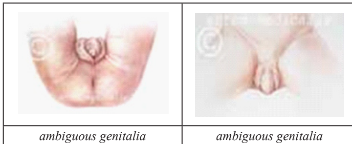
Rajah 1: Perbezaan ambiguous genitalia dengan alat kelamin normal 8

Dalam rajah 1 di bawah menunjukkan contoh gambar bagi masalah kekeliruan jantina atau ketidakpastian jantina ( ambiguous genitalia ) dan perbezaan alat kelamin normal manakala rajah 2 menunjukkan gambar sebenar bagi kes ambiguous genitalia yang mempunyai kedua-dua alat kelamin lelaki dan perempuan.