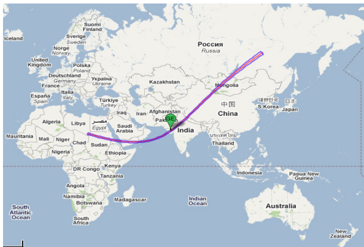
Rajah 3: Laluan Gerhana Matahari Cincin 27 Januari 632 M

Berdasarkan Rajah 3 ini, kelihatan bahawa laluan gerhana cincin melalui kawasan berhampiran kota Madinah. Justeru, penduduk kota Madinah dapat menyaksikan gerhana ini sebagai gerhana matahari separa pada sebelah pagi kerana kedudukannya hampir dengan laluan gerhana matahari cincin. Kegelapan gerhana matahari di kota Madinah dianggarkan sekitar 85%.