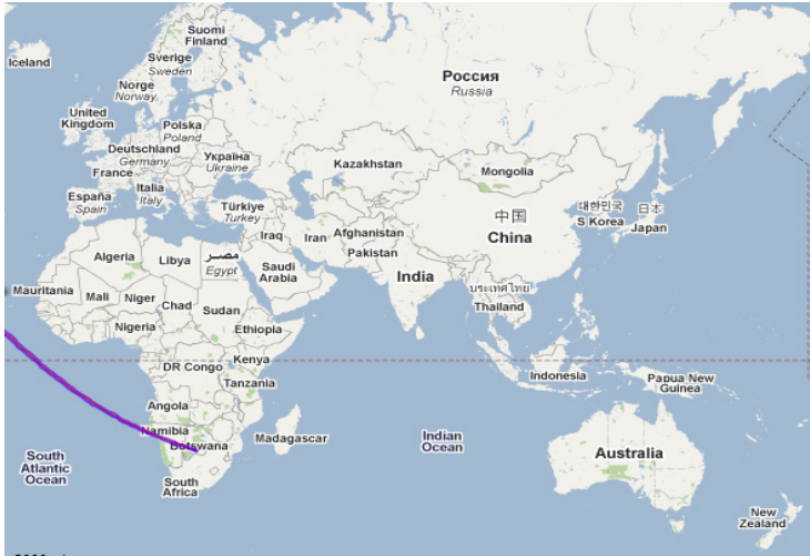
Rajah 2: Laluan Gerhana Matahari Penuh 3 Ogos 631 M

Berdasarkan Rajah 2 di atas, laluan gerhana matahari merentasi lautan Afrika Selatan dan hanya boleh dilihat di sebahagian kecil kawasan selatan benua Afrika. Justeru, dapat disimpulkan bahawa gerhana matahari yang berlaku ketika ini tidak dapat disaksikan oleh penduduk kota Madinah kerana kedudukannya amat jauh dari laluan gerhana matahari penuh.