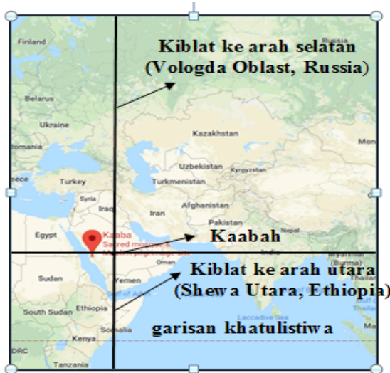
Rajah 1: Kawasan Kiblat ke Arah Utara dan Selatan

Dalam kes 1 di atas, kawasan kiraan berada di sebelah timur dan nilai longitudnya adalah sama dengan nilai longitud Mekah. Arah kiblat bagi kawasan tersebut boleh menghadap ke arah utara atau selatan berdasarkan kedudukan kawasan dari Mekah. Kedudukan kawasan tersebut adalah sama ada latitud kawasan itu kurang dari latitud Mekah atau lebih. Jika latitud kawasan tersebut lebih daripada Mekah maka arah kiblatnya akan menghadap ke arah selatan manakala jika latitud kawasan kurang daripada latitud Mekah maka arah kiblat akan menghadap ke arah utara.