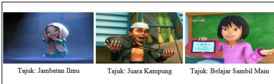
Gambar 4: Nilai tambahan atau kembangan dalam filem animasi Upin dan Ipin