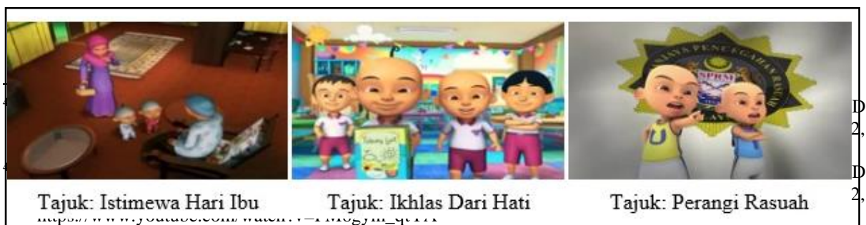
Gambar 3: Nilai Utama

Hal ini ditegaskan oleh Azirawati, Nor Raudah dan Yusmini 51 bahawa sifat dan akhlak Rasulullah SAW telah berjaya menarik perhatian orang ramai supaya tidak takut untuk mendekati Islam. Sifat kasih sayang, mengambil berat, bertoleransi, bersimpati yang ada dalam diri Rasulullah SAW dan para sahabat menjadi contoh teladan kepada masyarakat dalam menghadapi kehidupan dalam kepelbagaian kaum dan agama. Antara nilai utama yang terdapat di dalam filem animasi Upin dan Ipin adalah seperti berikut: