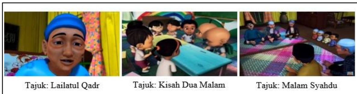
Gambar 1: Nilai Asas (Akidah)

Siri animasi Upin dan Ipin memiliki kelebihan dalam melahirkan masyarakat yang bersatu padu tanpa mengira bangsa dan agama. Kewujudan masyarakat majmuk dalam siri animasi ini menggambarkan bahawa Islam saling menghormati antara pelbagai kaum dan agama. Hal ini dijelaskan dalam Surah al-Hujurat ayat 13 yang bermaksud, “Wahai manusia! sesungguhnya, Kami telah menciptakan kamu daripada seorang lelaki dan seorang perempuan, kemudian Kami menjadikan kamu berbangsa-bangsa dan bersuku-suku agar kamu saling kenal mengenali. Sesungguhnya yang paling mulia di antara kamu di sisi Allah ialah orang yang paling bertakwa. Allah Maha Mengetahui lagi Maha Teliti.”