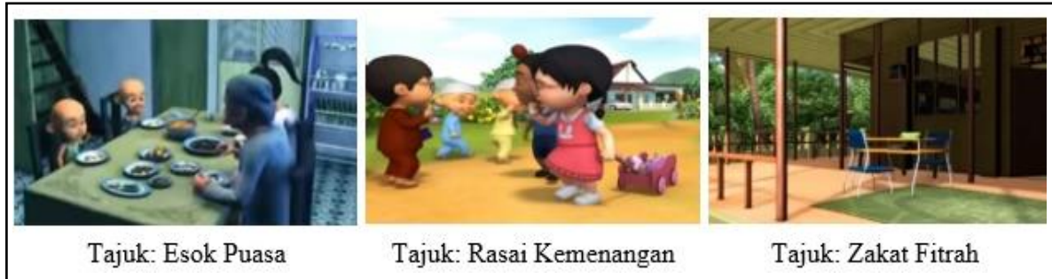
Tajuk: Esok Puasa